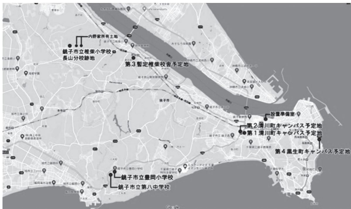
銚子市における学校法人立短大設置の関係地理

学校法人の名称は、「太陽系学園」と命名されました。大学は、現役学生や卒業生だけでなく、関心のある日本中の「関係市民」を巻き込み、寄附とサービスの関係を通じて生涯にわたる「共生」(きょうせい、ともいき)の中核、太陽系の「太陽」であるべきだ、との見解です。